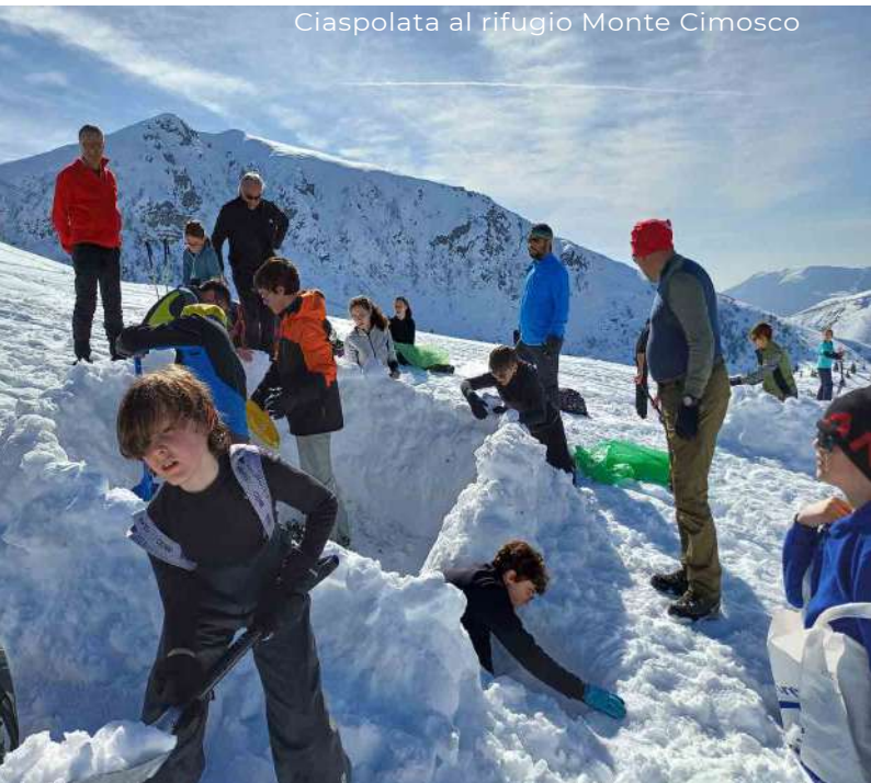
Ciaspolata al rifugio Monte Cimisco

Le sezioni del CAI di Chiari, Coccaglio, Palazzolo sull'Oglio e Rovato, unite nel gruppo Alpinismo Giovanile Montorfano , promuovono per ragazzi dagli 8 ai 17 anni, esperienze di formazione, da vivere con spirito di condivisione, di collaborazione, di avventura e di adattamento per scoprire il mondo affascinante della montagna.