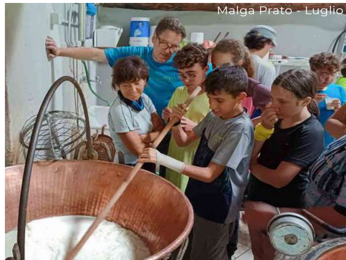
Malga Prato - Luglio