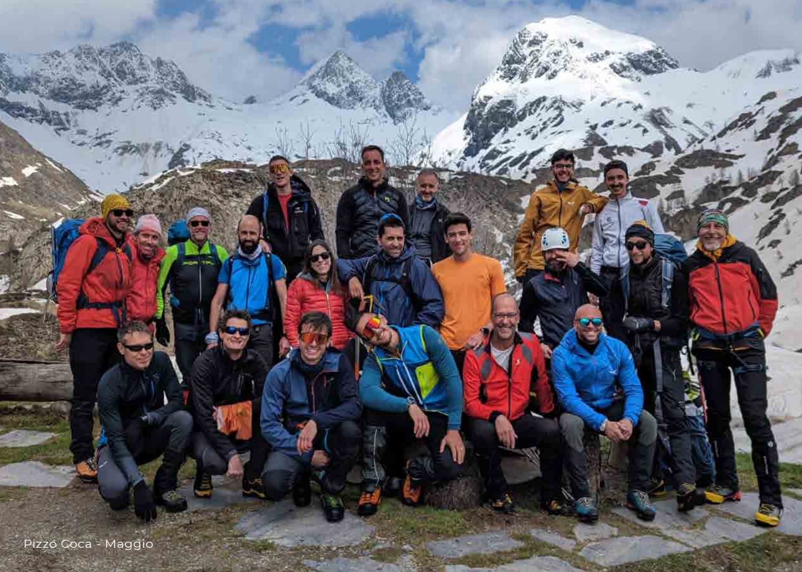
Pizzo Coca - Maggio