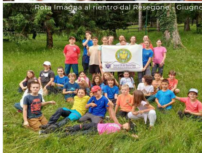
Rota Imagna al rientro dal Resegone - Giugno