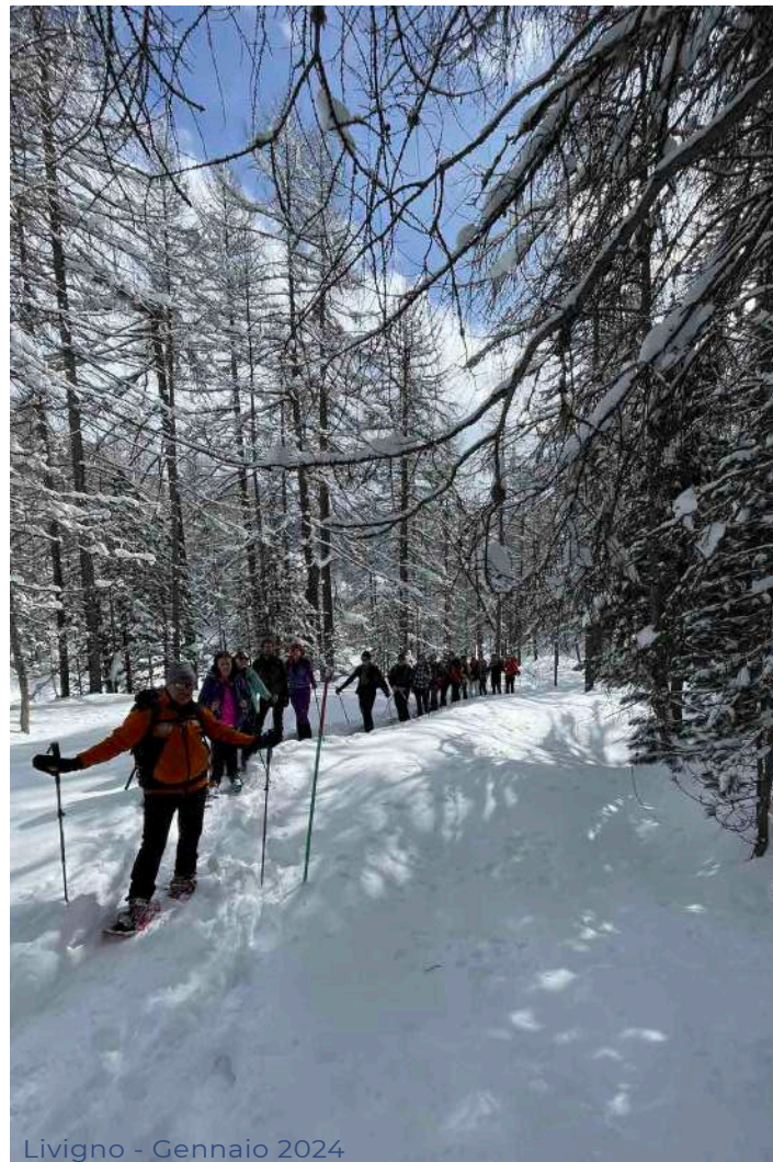
Livigno - Gennaio 2024