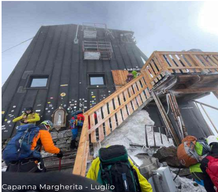
Capanna Margherita - Luglio