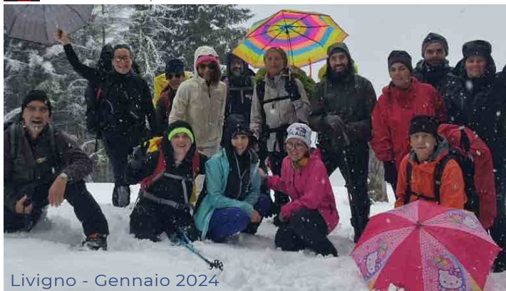
Livigno - Gennaio 2024